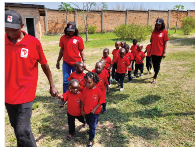
Børnehavens børn på vej til indvielsen