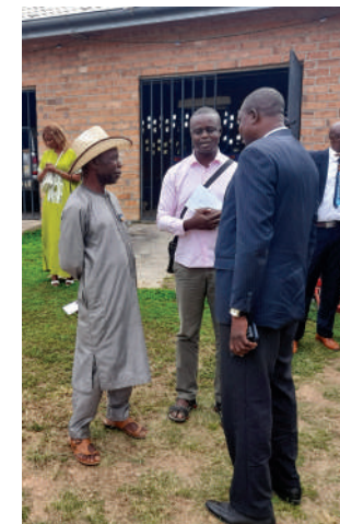
Den lokale høvding (med hat) i samtale med andre gæster ved indvielsen.

Efter besigtigelse af en del af bygningerne og det omliggende areal bliver den tilberedte mad serveret og indta-